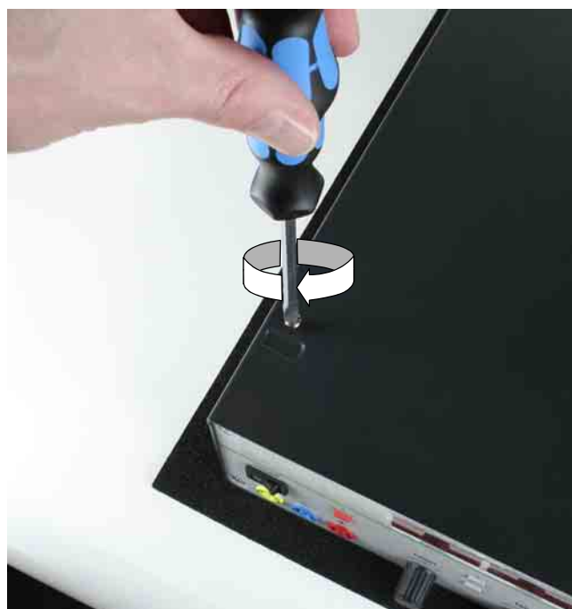
Bild 4 Geräteoberseite: Halsschraube (aus Bild 2) hineindrehen Figure 4 Device top: Insert collar screw (see Figure 2)