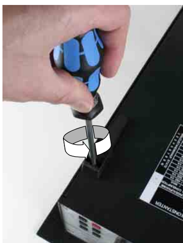
Bild 2 Geräteunterseite: Halsschraube des Fußes herausdrehen; Schraube wird wiederverwendet, siehe Bild 4