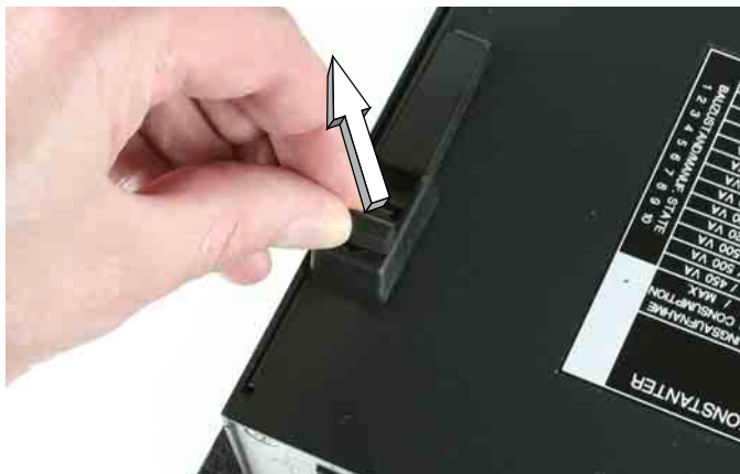
Bild 1 Geräteunterseite: Gummipuffer herausziehen Figure 1 Housing bottom: Pull out rubber latch