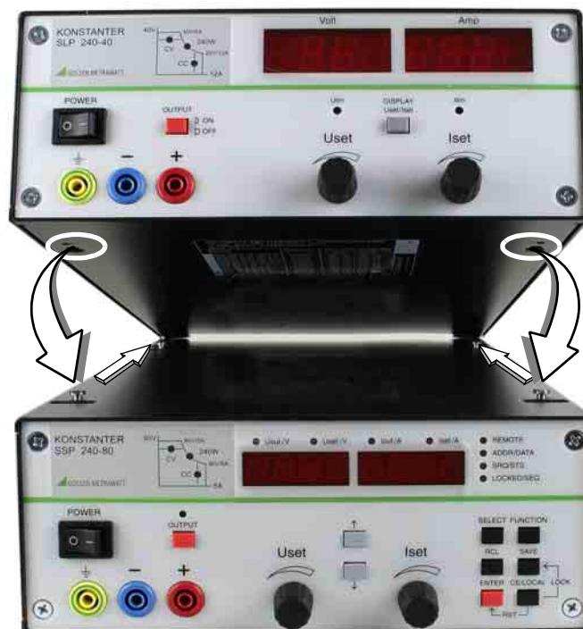
Bild 5 Oberes Gerät über Schlüssellocher auf Unterem fixieren: a) Gehäuse so aufsetzen, dass Halsschraube in Bohrung passt b) oberes Gehäuse nach hinten schieben