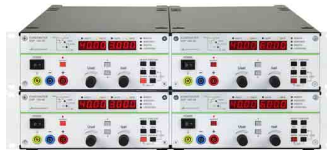
Bild 10 Beispielansicht: 19"-Einbau über 19"-Adapter (4 x 32N) Figure 10 Installation example: 19" installation via 19" adapter (4 x 32N)