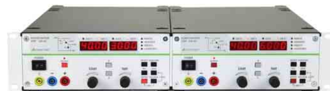
Bild 9 Beispielansicht: 19"-Einbau über 19"-Adapter (2 x 32N) Figure 9 Installation example: 19" installation via 19" adapter (2 x 32N)