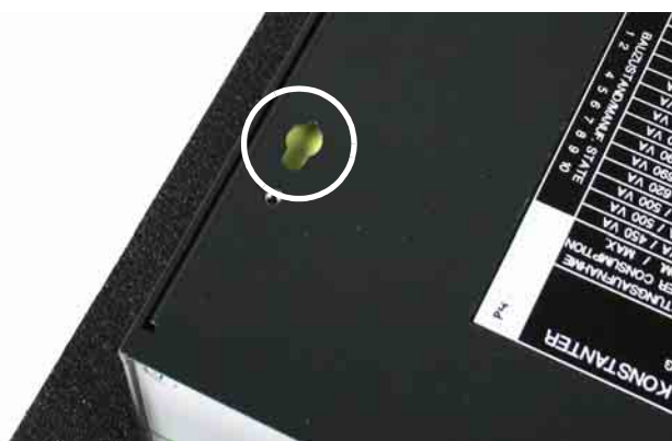
Bild 3 Geräteunterseite: Fuß abnehmen, Schlüsselloch wird frei Figure 3 Device bottom: Lift off support, keyhole is exposed