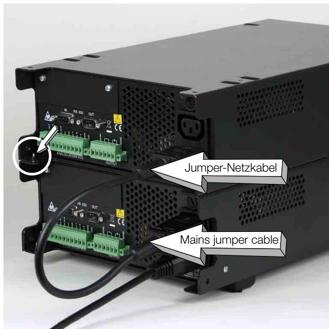
Bild 6 Rückseite fixieren: mit mitgelieferter Kreuzschlitzschraube (M3x8) Aufstellenschutzwinkel verbinden Figure 6 Fix rear side: Connect installation shield angle by using the included Phillips screw (M3x8)